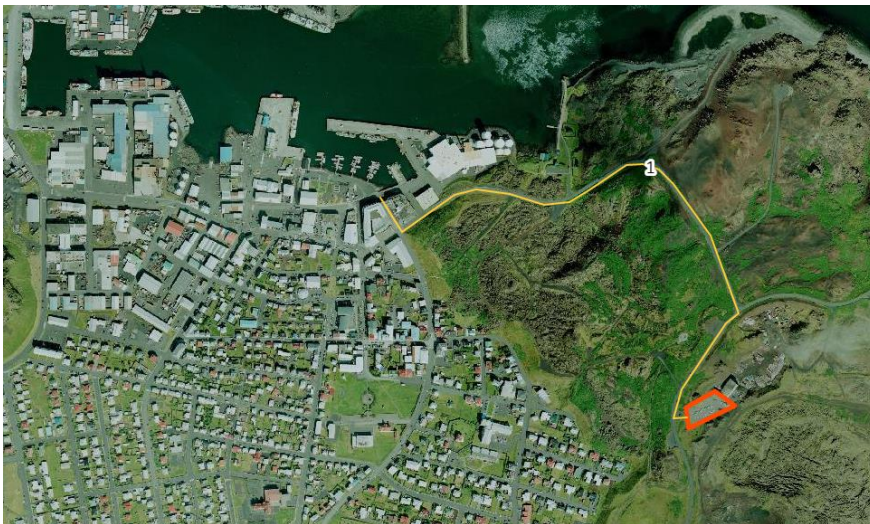
Móttökustöð sorps við Eldfellsveg | gámasvæði