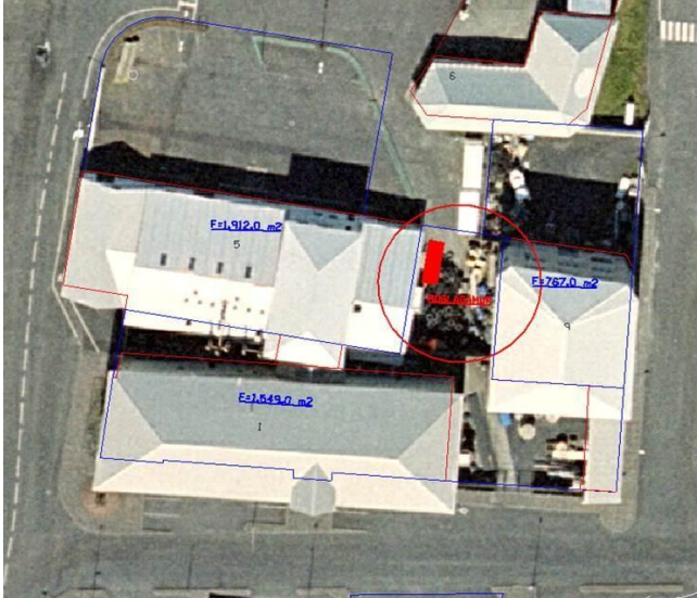
Gámur vegna móttöku sorps af smábátum | hafnarskrifstofa