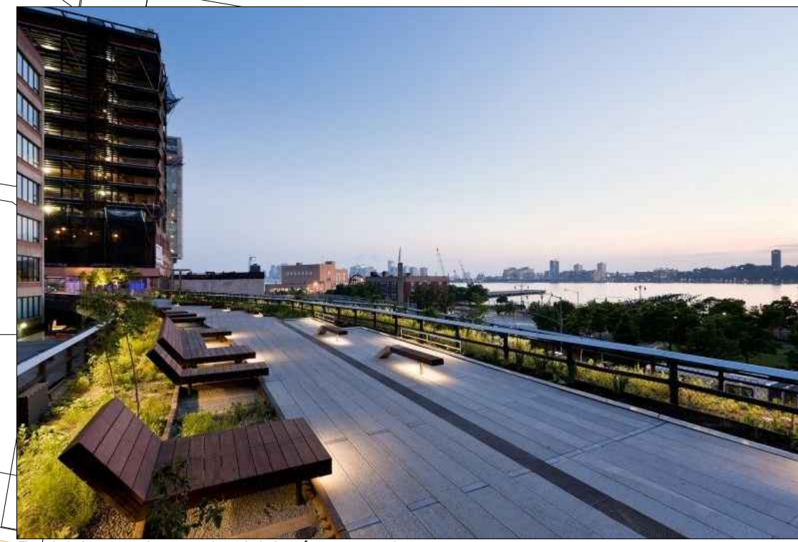
Békkir og legubékkir á svæðinu