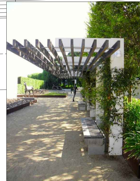
Setsvæði yfirbyggt að hluta