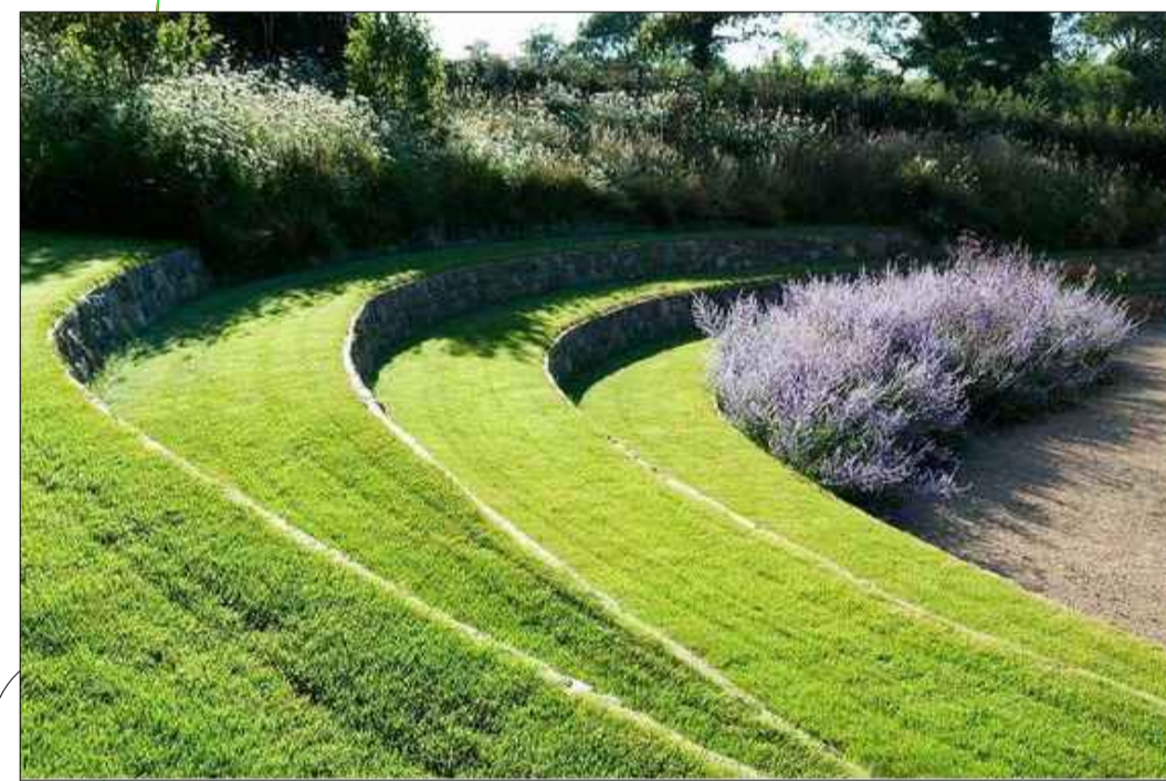
Dæmi um setbrekku