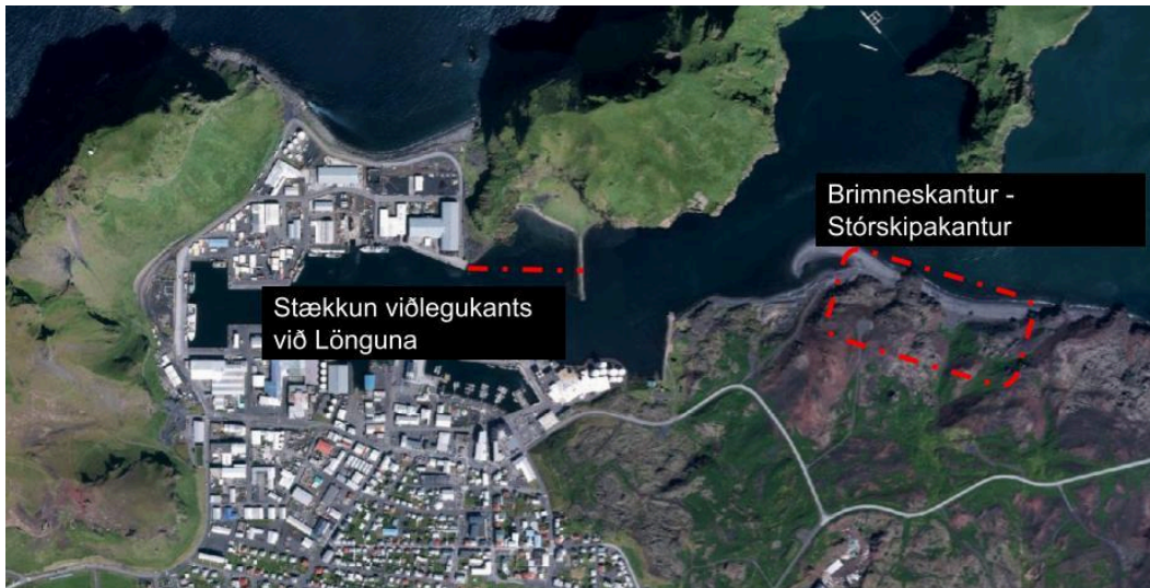
Mynd 1.1. Staðsetning svæða sem til stendur að breyta stefnu um í aðalskipulagi Vestmannaeyjar er hér gróflaga merkt inn á loftmynd af norðanverðri Heimaey.

Vestmannaeyjahöfn er grundvöllur helstu atvinnustarfsemi og samgangna til og frá Heimaey. Athafnasvæði hafnarinnar er orðið aðþrengt og skilyrði til að taka inn stór skip erfið. Til að tryggja nægt athafnarými og viðlegukanta við höfnina hafa bæjaryfirvöld áformað að stækka hafnarsvæðið og breyta aðalskipulagi á þeim svæðum þar sem ákjósanlegustu aðstæður eru taldar fyrir hafnarbakka, m.a. með tilliti til mögulegrar legu og athafna fyrir stærri flutningaskip. Í Aðalskipulagi Vestmannaeyja 2015-2035 er nú þegar gert ráð fyrir stórskipakanti fyrir utan Eiðið sem og landfyllingu á því svæði. Er sú staðsetning enn talin fýsilegur kostur en kostnaðarsöm og umsvifamikil framkvæmd. Með tilkomu landeldis í Viðlagafjöru verður til nýtt athafnasvæði hafntengdar starfsemi á austurhluta Heimaeyjar og því skapast forsendur fyrir að hafnarsvæði fyrir flutningaskip verði staðsett austar á eyjunni. Það er talinn fýsilegur kostur að stækka hafnarsvæðið við Skansfjöru til austurs út í Gjábackkafjöru og reisa svokallaðan Brimneskant. Mikil aukning hefur verið á gámaútlutningi á undanförunum árum og ljóst að þörf er fyrir stækkun á gámasvæði. Því eru áform um að byggja upp slíkt svæði við Brimneskantinn. Að auki er horft til stækkunar viðlegukants við Lönguna í átt að Hörgaeyrargarði auk styttingar Hörgaeyrargarðs. Staðsetning fyrirhugaðra breytinga sést á mynd 1.1. Skipulagslýsing þessi er fyrsti liður í þessum breytingum.