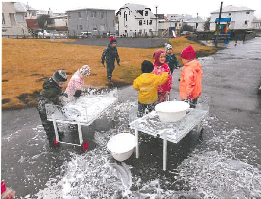
Hér má sjá drengi í lok samskonar verkefnis.